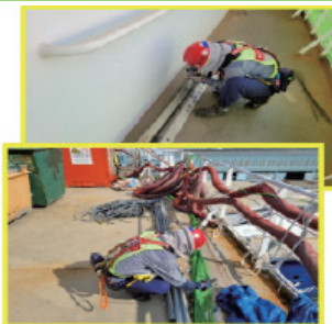
작업현장 순회점검 및 개선요구(공유)